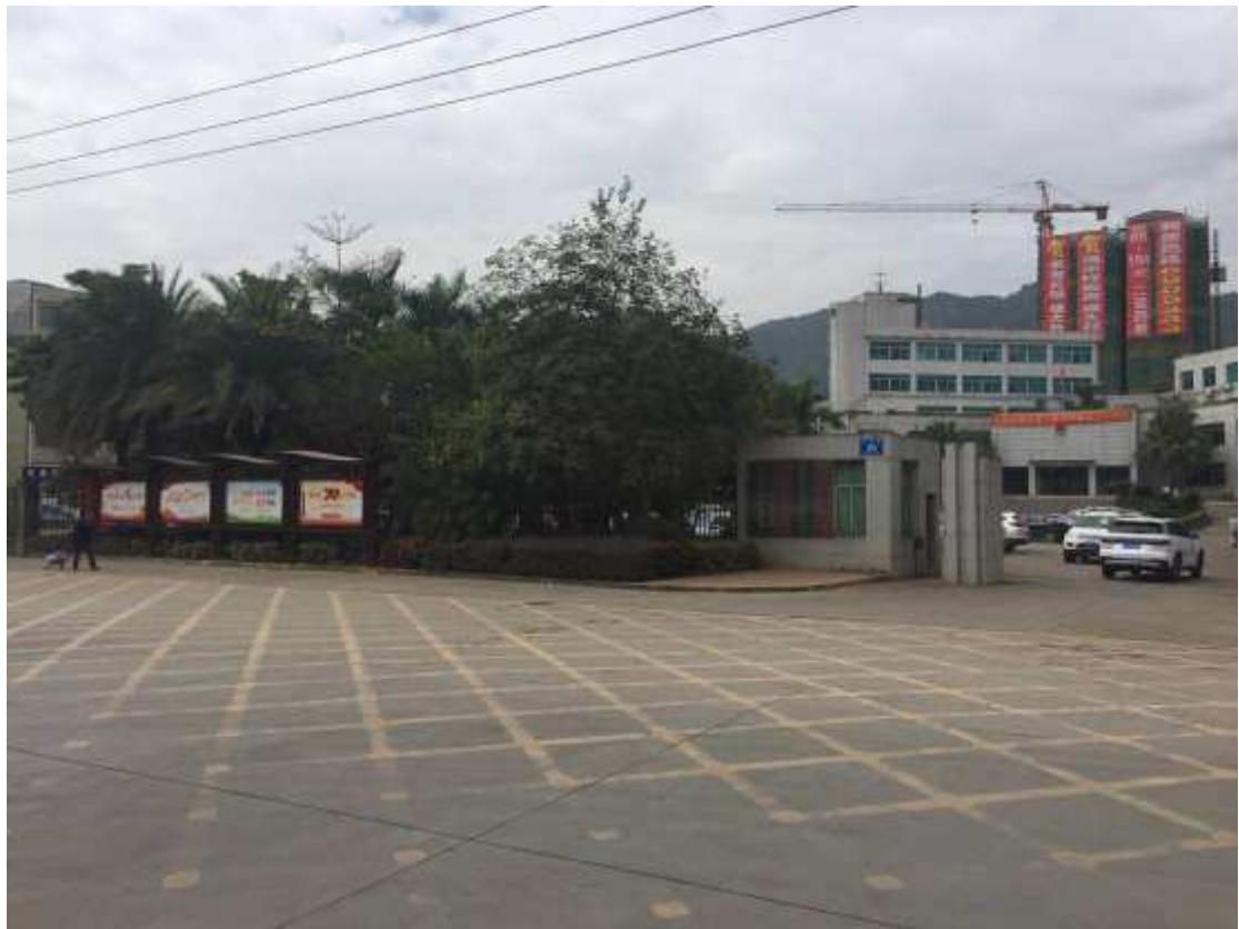
图 3-4 项目在泰美镇镇政府公告栏张贴公示照片。