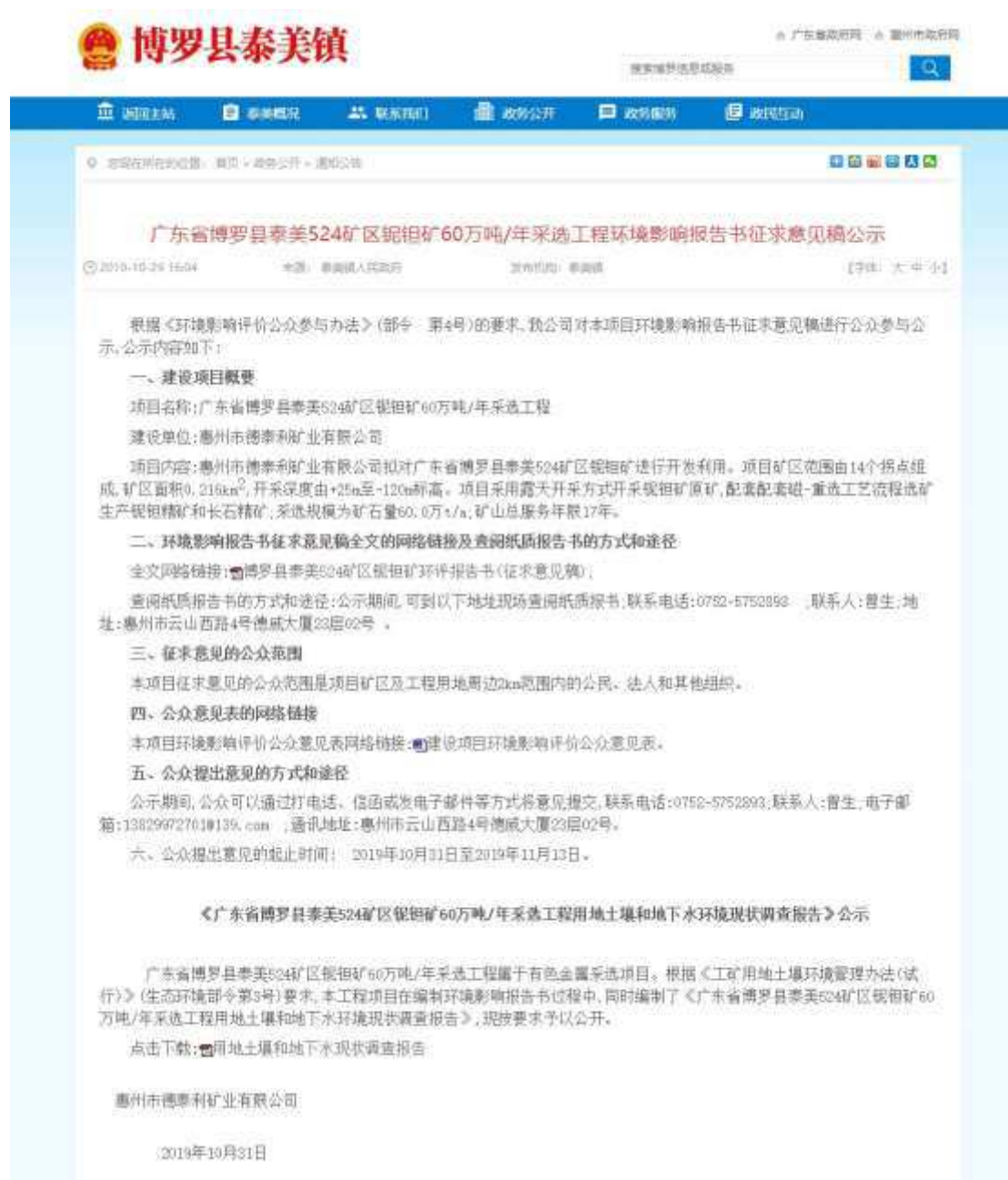
图 3-1. 项目环评征求意见稿网络公示截图