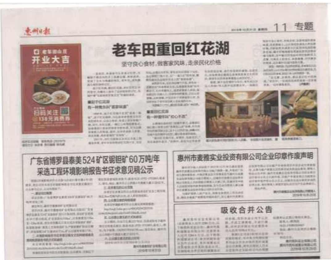
图 3-2 项目环评征求意见稿第一次报纸公示截图