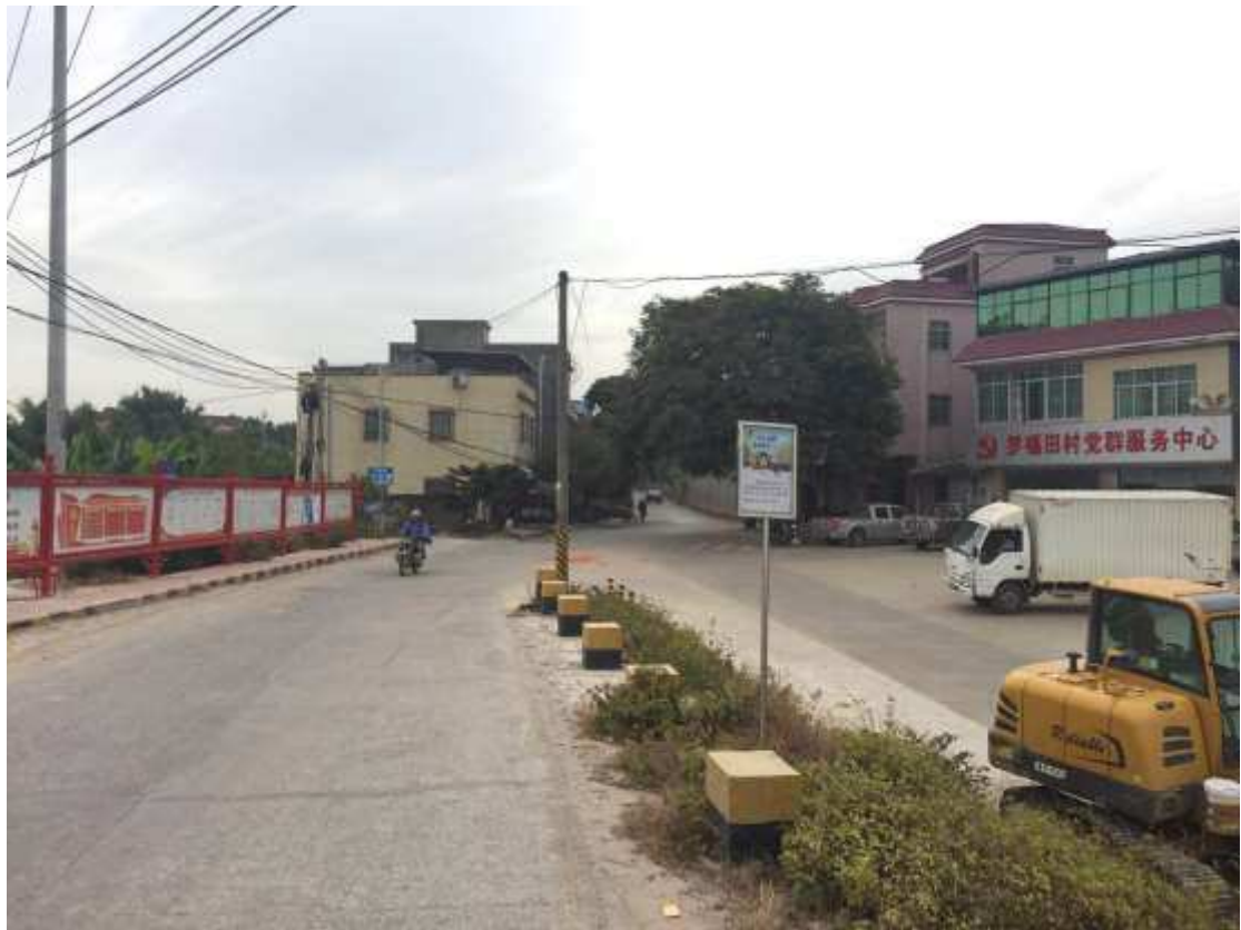
图 3-5 项目在罗福田村村委公告栏张贴公示照片。