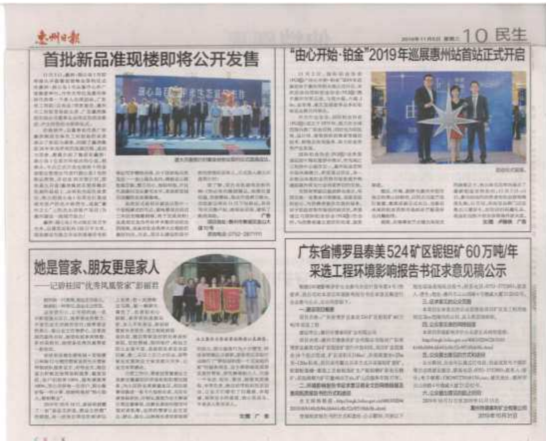
图 3-3 项目环评征求意见稿第二次报纸公示截图